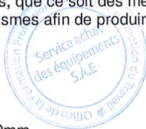
Tableau de répartition