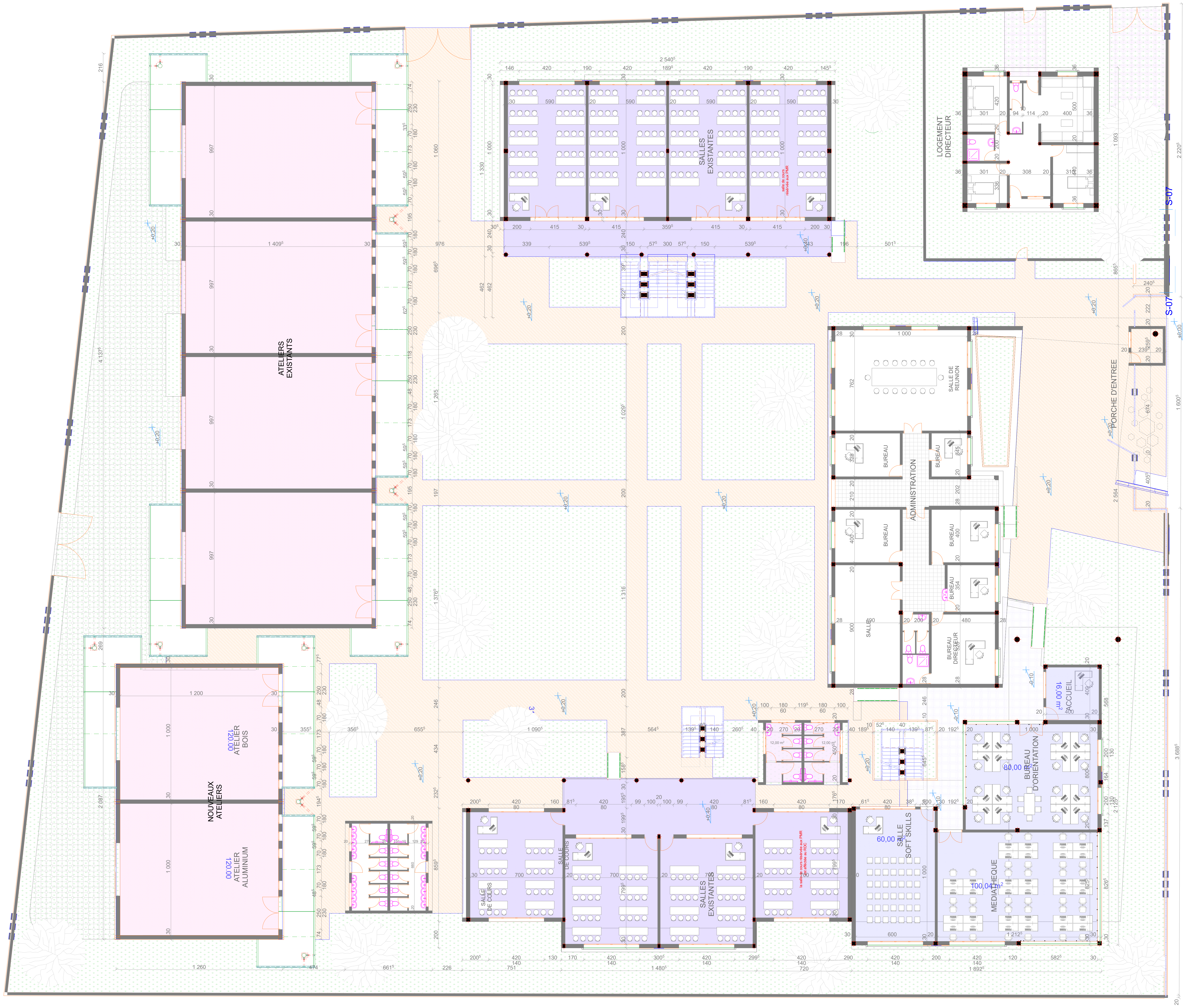
PLAN DE L'ENSEMBLE (RDC)